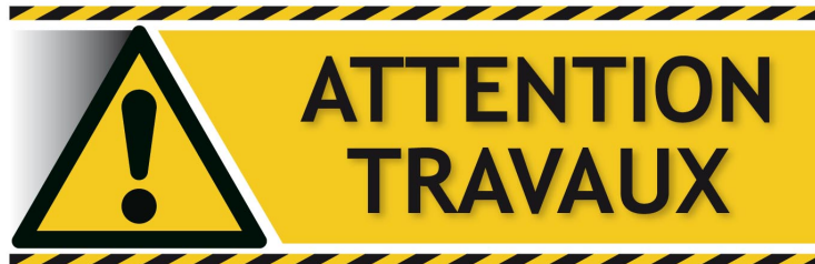
RN 124 - Déviation de Gimont