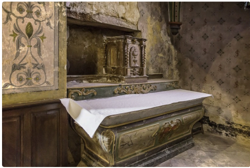
Le maître autel remis dans une chapelle latérale avec le tabernacle