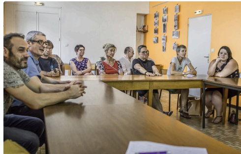
Les commerçants lors de la réunion