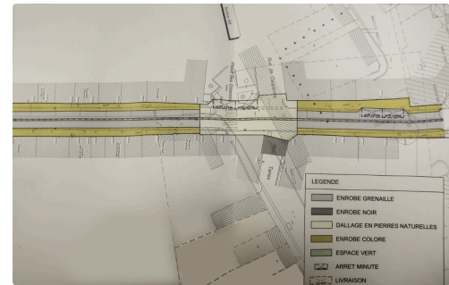
Plan partie basse