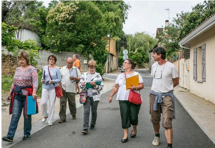
Nogaro – Concours de fleurissement des jardiniers amateurs