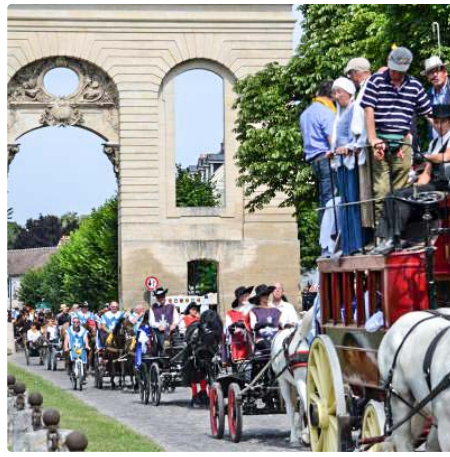
Le cortège parcourt 8 km entre le polo-club et le château