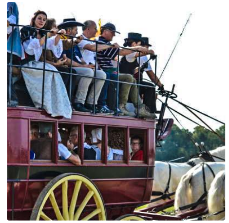
Un omnibus ? Non, une diligence tirée par 3 braves chevaux boulonnais