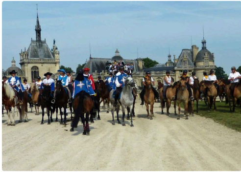
Devant le château