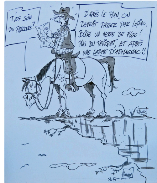
Dessin de Joyeux, dessinateur de presse humoriste et caricaturiste