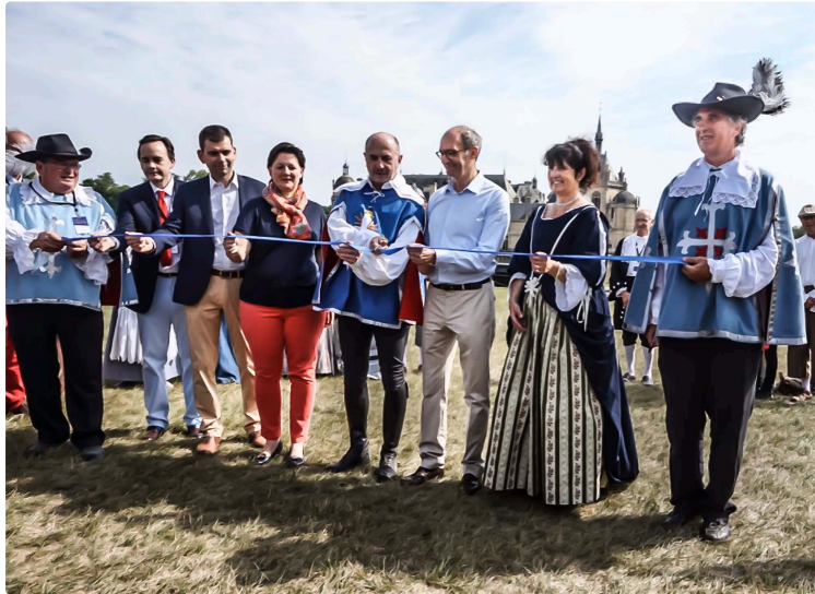
Lupiac – Inauguration festive de la Route équestre d’Artagnan

La Route équestre européenne d’Artagnan, c’est parti officiellement : une magnifique cérémonie d’inauguration a lieu lors du week-end du vendredi 7 au dimanche 9 juillet dans une capitale de l’équitation française, Chantilly.