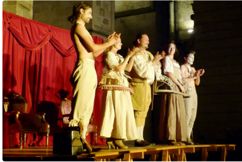
C'est déjà fini , quel dommage !