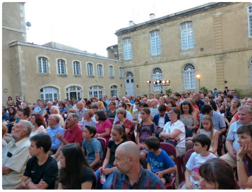
La cour de la préfecture , salle comble !