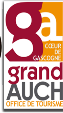
AUCH avec Molière , quel régal !

Hier soir Mr le Préfet du Gers accueillait la Compagnie A invitée de la première "Soirs d'été" de la saison estivale organisée par le Grand Auch Cœur de Gascogne, Pays d'art et d'histoire .