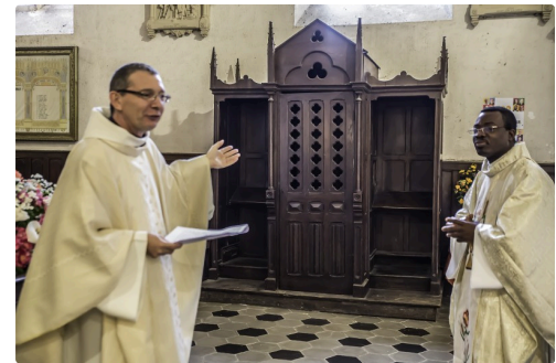
... le confessionnal...