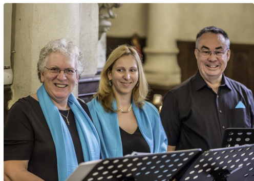
Le brain trust de la chorale

(1) La paroisse est composée des villages d'Aignan, Bouzon-Gellenave, Castelnavet, Fustérouau, Loussous-Débat, Margouët-Meymes et Sabazan. (2) Jean 17 1b-2a. (3) La vie éternelle, c'est qu'ils Te connaissent, Toi le seul vrai Dieu et celui que Tu as envoyé, Jésus-Christ ».