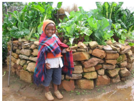
Un jardin en Afrique.