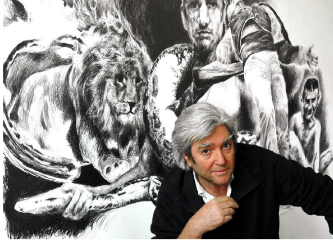
Chambas : dessiner, peindre...50 ans

Vic-Fezensac s'apprête à accueillir l'enfant du pays pour une vaste exposition d'une tournée itinérante