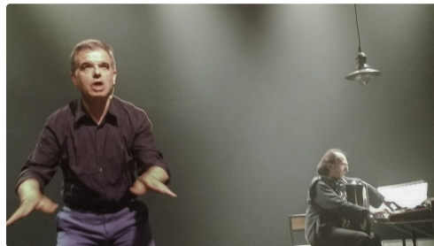
Christian Laborde en scène