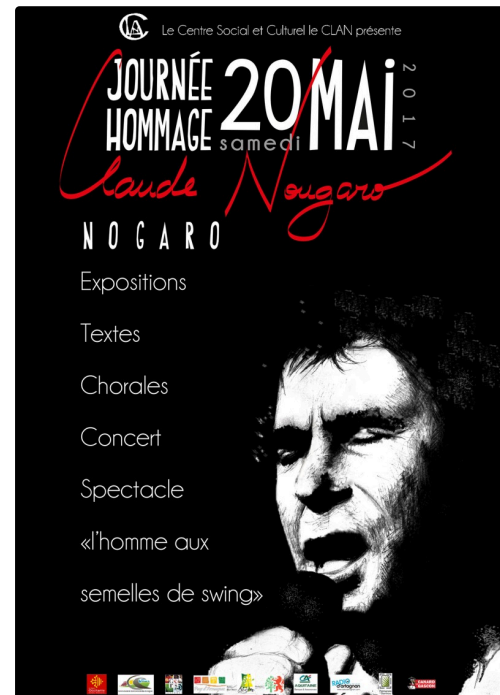
Affiche de l'hommage à Claude Nougaro