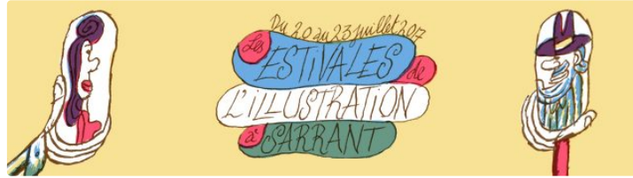
Sarrant - 4ème édition des Estivales de l'illustration

La crème des illustrateurs se réunit cet été à Sarrant