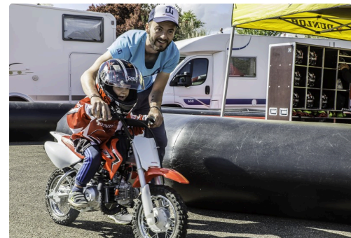
Un gamin émerveillé