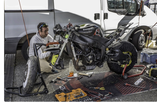
Une révision complète