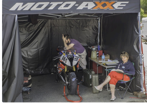
La tente de Moto-Axe