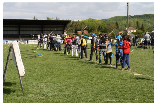
Archers en action.

D'autres challenges de ball-trap seront proposés le 29 juillet lors de la fête locale (16 heures à 2 heures du matin), puis le 13 août (toute la journée) et enfin le 9 décembre lors du Téléthon.