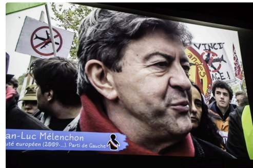
Photo de manifestation prise sur l'écran lors de la projection