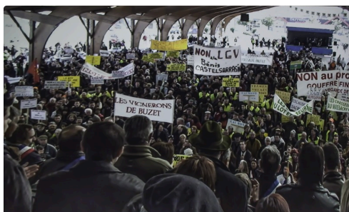
Photo de manifestation prise sur l'écran lors de la projection