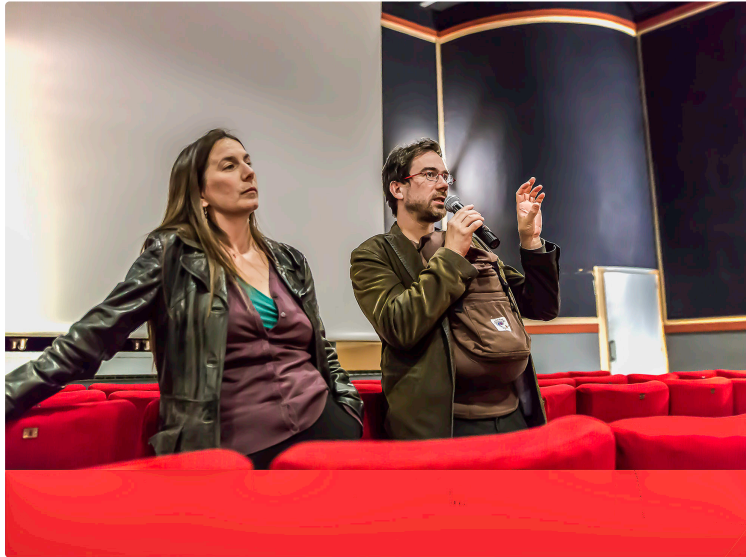
Nogaro – Film et débat sur les grands projets d'infrastructure

Les HalluCinés (1) présentent le 26 avril un film engagé politiquement, dont on peut ne pas approuver les thèses. Mais il semble intéressant de les connaître, ne serait-ce que pour les discuter. « L'intérêt général et moi » des réalisateurs Sophie Metrich et Julien Milanese. Ceux-ci lancent le débat après la projection : faut-il s'opposer aux grands projets d'infrastructure, qu'ils renomment «Grands projets inutiles imposés » (GPII). Pourquoi s'y opposer et est-ce que le mouvement d'opposition remet en cause la démocratie ?