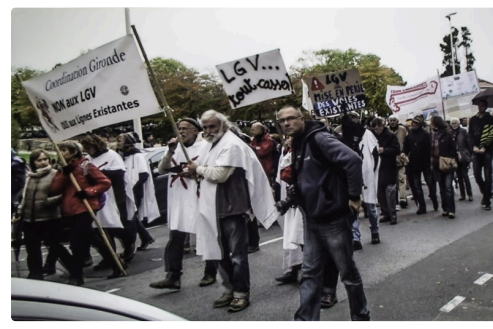
Photo de manifestation prise sur l'écran lors de la projection