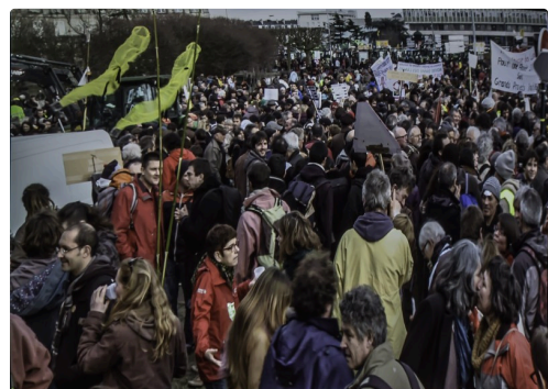
Photo de manifestation prise sur l'écran lors de la projection