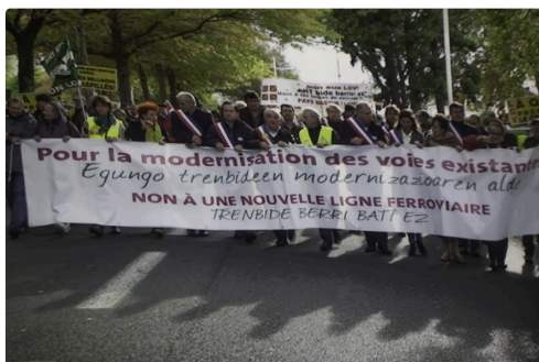
Photo de manifestation prise sur l'écran lors de la projection