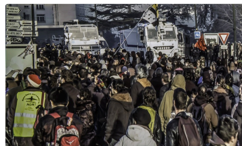
Photo de manifestation prise sur l'écran lors de la projection