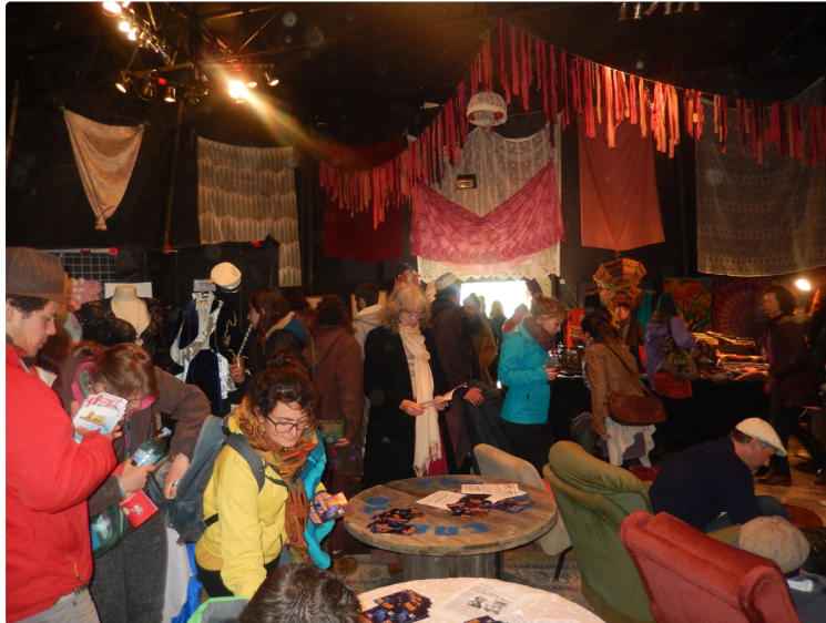
Welcome in Tziganie c'est parti et bien part

Un passage par Seissan s'impose ce week end