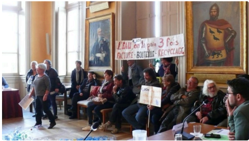
Le groupe des manifestants des Amis de la Terre et d'EAuch bien commun.