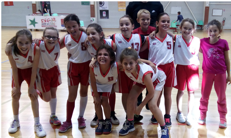
MIRANDE Basket Un tournoi Gilles Escudé

Le Basket Club Mirandais organise le 28 avril le premier tournoi Gilles Escudé destiné aux catégories poussines et poussins.