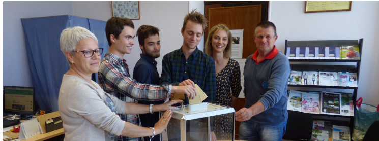
Monpardiac Elections présidentielles

Des triplés votent pour la première fois