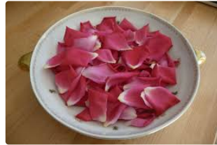
Fête des Fleurs 2017 – jeudi 25 mai

Les abonnés de la médiathèque participent !