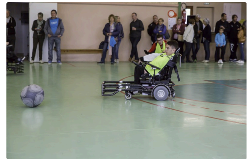
Nouveau shoot et nouveau but