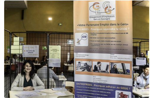
Stand du Groupement d'employeurs Gers en Gascogne