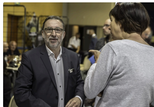
Christian Peyret inaugure le Forum

Ci-dessous un album d'une partie du Salon.