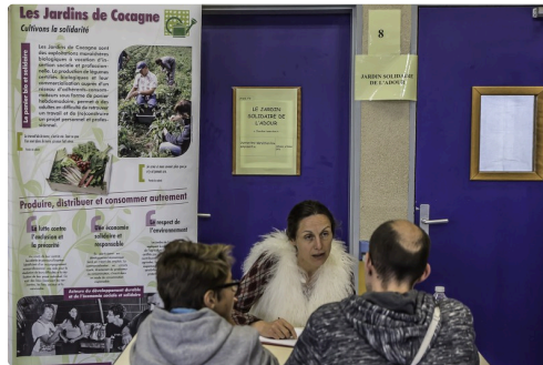
Stand du jardin solidaire de Cahuzac-sur-Adour