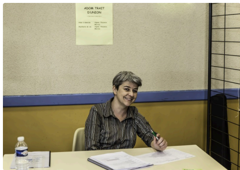
Stand très spartiate de l'Adom-Trait d'union