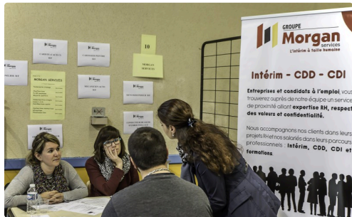
Stand du Groupe Morgan