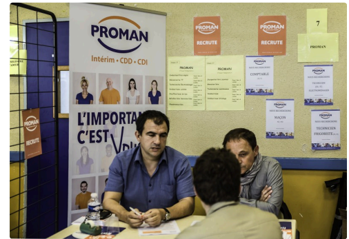
Stand de Proman