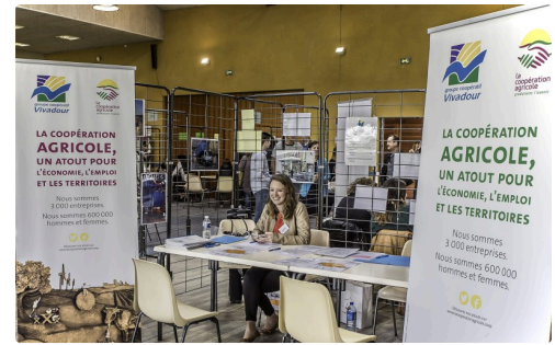
Stand de Vivadour