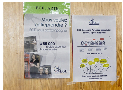
Affiches du stand BGE-Arte qui, notamment, aide à la création d'entreprises