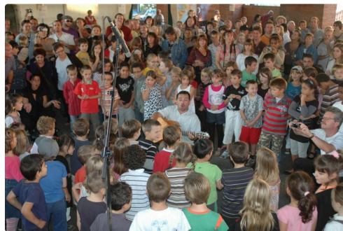
Fête de Catinou - Hèsta de la Catinon