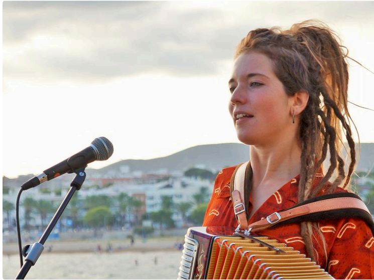
SENT-LIS : H