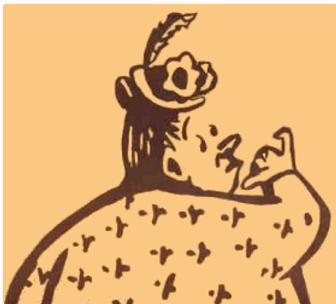
Le personnage de Catinou, imaginé par le regretté Charles Mouly - Le personatge de la Catinon, pensat peu praube Carles Molin