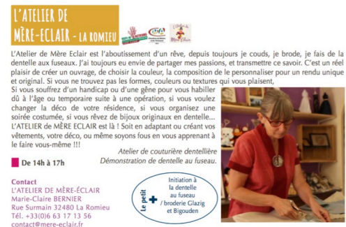
atelier mere eclair dimanche 9 avril.jpg