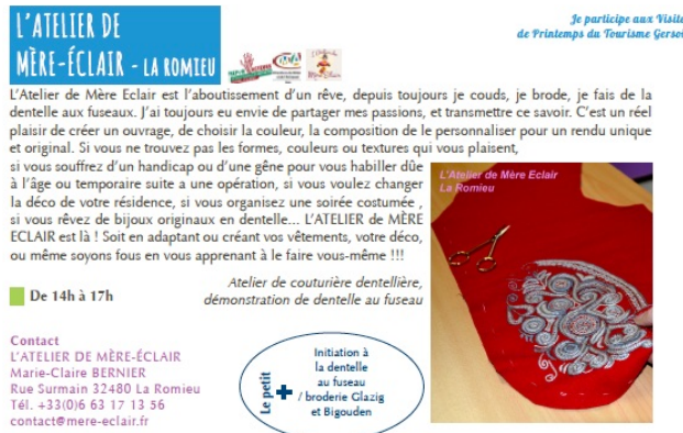
La Romieu: L'atelier de Mère Eclair participe aux Visites de Printemps 2017

Organisé par le Comité Départemental de Tourisme du Gers