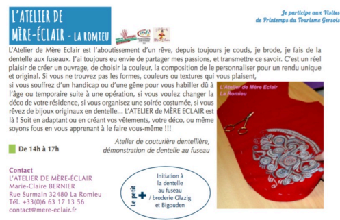
atelier me-re eclair vendredi 7.jpg

Pour plus d'information et le programme complet: http://www.tourisme-gers.com/gers-tour/2017/actu/visites-printemps-tourisme-destination-Gers2017.pdf