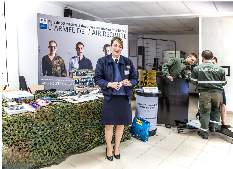
Nogaro – La Base de Mont-de-Marsan à la cité scolaire