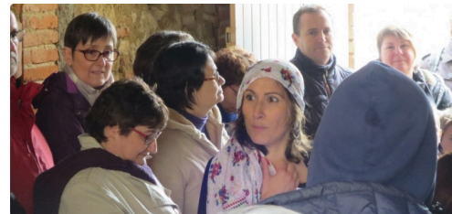
Le public attentif à la lecture des textes choisis