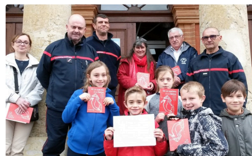
Les écrivains en herbe