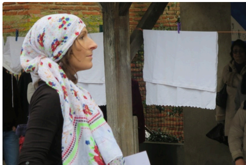
Lecture déambulée dans les rues de Lombez