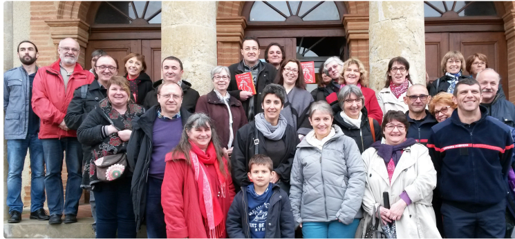
Forum national du Groupement des écrivains conseils®

Chaque printemps, le Forum annuel du Groupement des écrivains conseils®(GREC) a lieu dans une région de France différente, afin de permettre à ses membres de découvrir, échanger et partager.