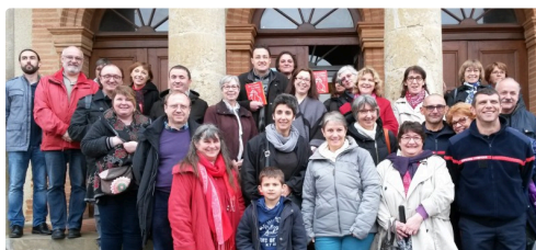
Photo de famille pour ce 15ème Forum du GREC