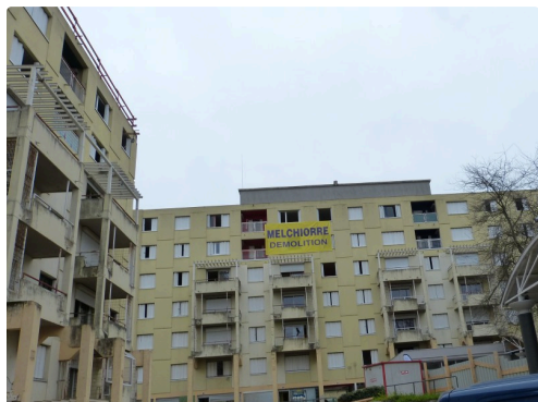
D'ARTAGNAN et PORTHOS, le début de la fin.

Pour en savoir plus sur la société MELCHIORRE