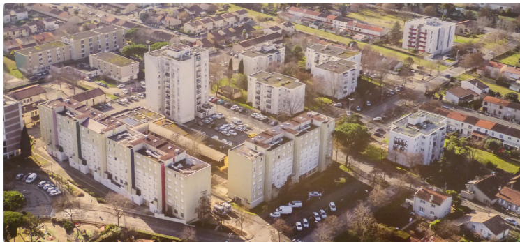
AUCH : le GARROS nouveau.