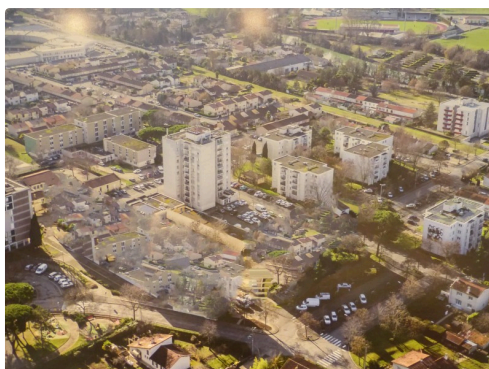
Peut-être demain ( photo traitée avec inPixio photo)