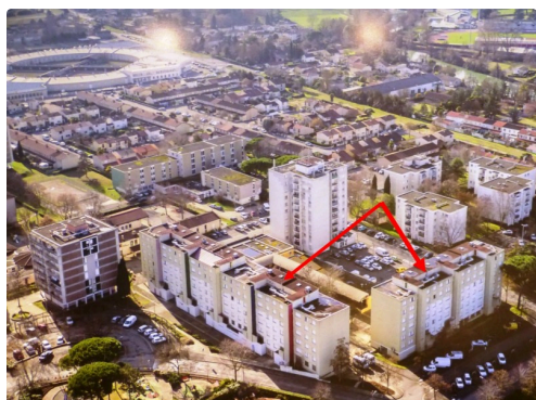
vue du Garros avec les deux bâtiments à détruire