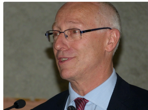
Pierre ORY Préfet du gers.