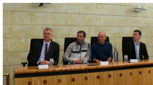
Les professeurs et directeurs de l'EPL et du LPA.