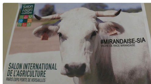
La vache mirandaie pourrait bien être à l'affiche d'un prochain Salon international de l'agriculture à Paris.

Vous aimez le journal du Gers ! Entrez nos coordonnées dans votre smartphone Vous êtes témoin d'un événement, d'un accident. «clac» photo - «clac» envoi tel 06 52 00 34 79 e-mail contact@lejournaldugers.fr MERCI