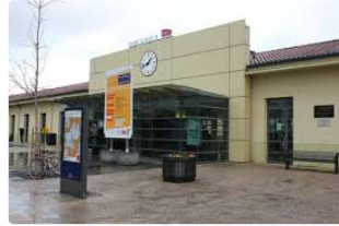
Du nouveau en gare d'Auch

Un vélo écolo high tech oeuvre pour votre santé et l'environnement