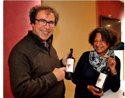
En plus des bouteilles ils ont gagné deux repas à la fête du vignoble