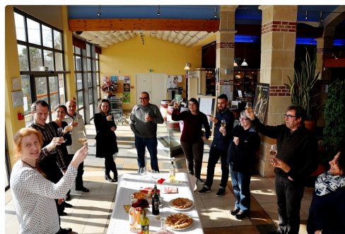
Les mêmes au réconfort