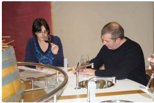
Madame hume monsieur note