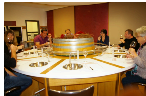
Les dégustateurs du soir