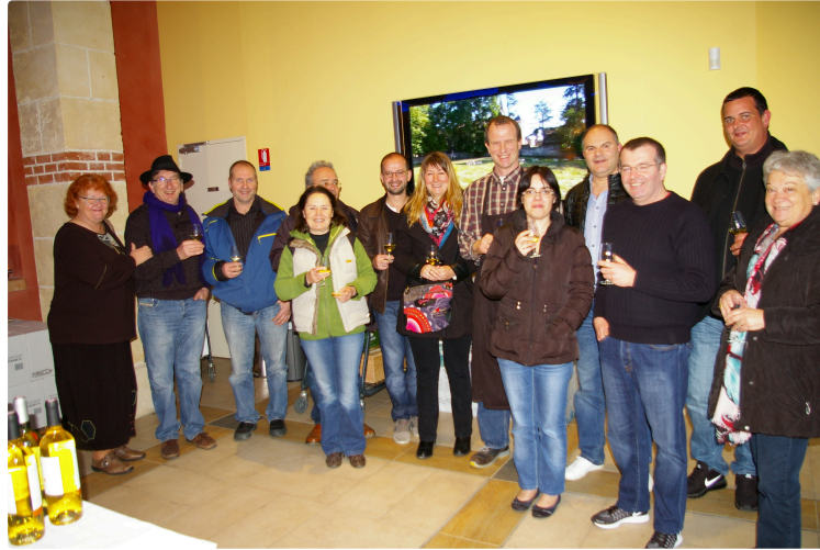
Ils ont fait battre leur coeur de Valentin pour Saint-Mont

Samedi, la cave du Saint-Mont à Saint-Mont organisait en matinée et après-midi deux ateliers destinés à des néophytes ou pas, habitants de la région ou de fort loin, pour faire battre leur cœur de "Valentin" pour le Saint-Mont en rassemblant leur propre cuvée pour la "Saint-Valentin".