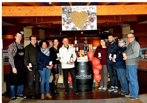
L'atelier matinal à la photo souvenir

Les deux dernières propositions nettement plus qualitatives avec le passage en bois n'ont pas fait l'unanimité, preuve que tous les goûts sont dans la nature. Chacun des participants repartait avec sa bouteille assemblée avec les pourcentages de ses choix. Au rez -de-chaussée, un lunch composé de produits locaux commercialisés sur place, liquides et solides, régalaient tous ceux qui avaient concouru. Ils avaient apprécié les ateliers de l'étage, ils ont aussi apprécié l'au revoir du premier niveau.