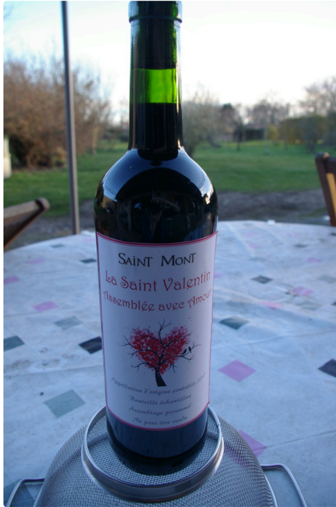
Les participants repartaient avec la bouteille de leur assemblage