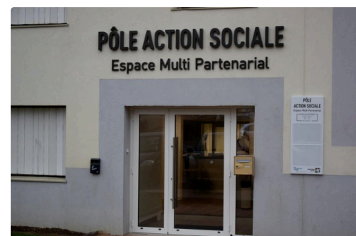
Le Pôle d'action sociale multi-partenarial quartier du Garros qui intégrera le Centre d'exams de santé à compter du 22 février