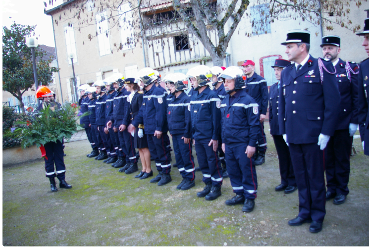
La Sainte-Barbe des pompiers de Plaisance

Après Lasserrade l'an passé, c'est Izotges qui accueillait cette année les pompiers plaisantins pour la présentation de leur bilan annuel.