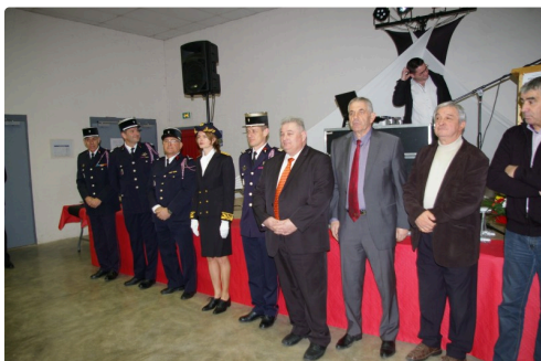
Les personnalités présentes à la Sainte-Barbe