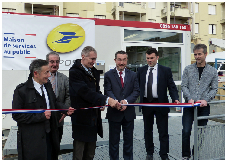
AUCH GRAND GARROS : Maison de Services au Public (MSAP).