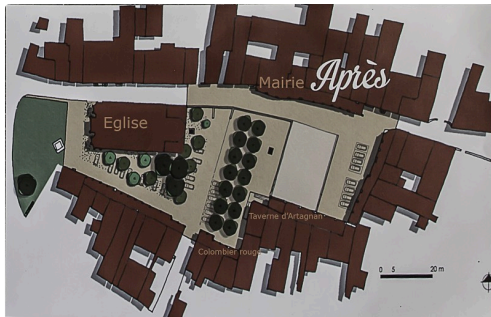
Plan de l'aménagement de la place d'Artagnan - Archives Roland Houdaille