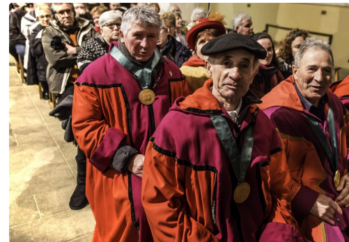
Des membres de la confrérie du Pacherenc