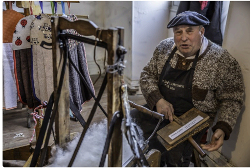
Le cardeur de laine