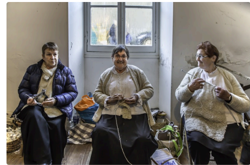
Vieux métiers : les tricoteuses