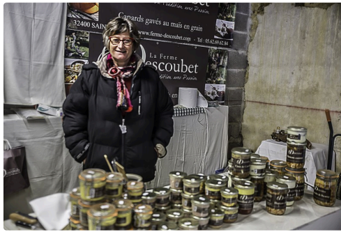
Produits du canard