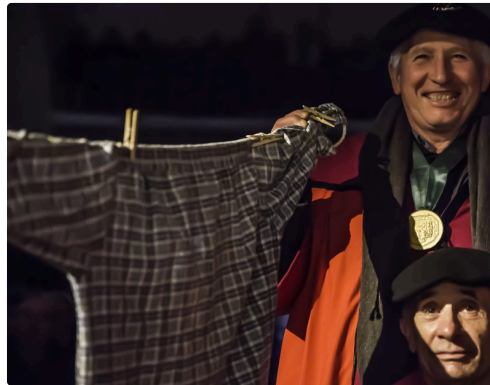
... au milieu du public