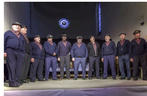
Les chanteurs vigneronns du Pacherenc du Vic Bilh