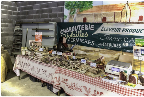
Marché de producteurs locaux : charcuterie