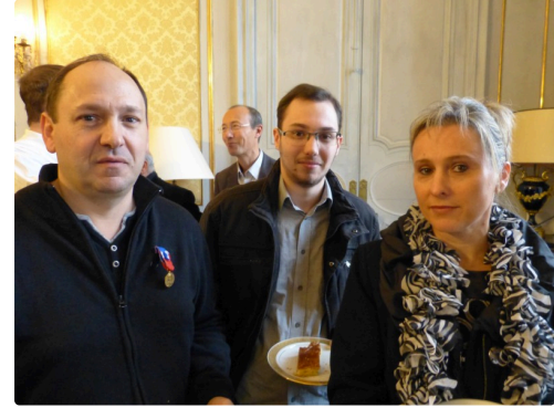
La famille du récipiendaire.