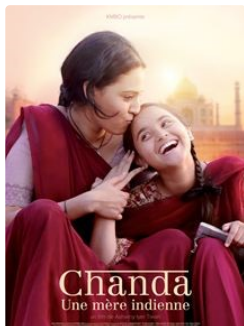
affiche du film