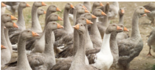
Hécatombe de volailles gersoises suite au virus H5N8 mis a jour 26/12/2016

28 élevages plus de 100 000 volailles touchés par le virus