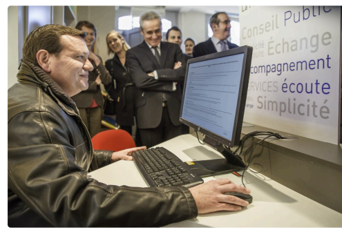
Démonstration sur ordinateur