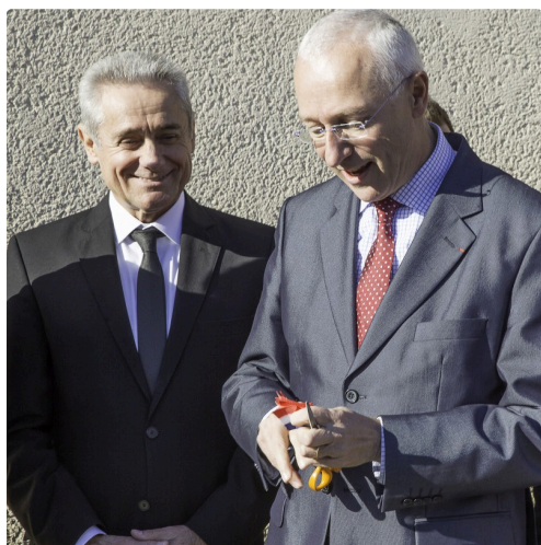
Le préfet coupe le ruban en morceaux qu'il donne aux officiels