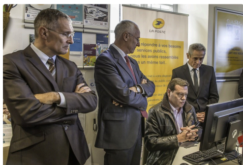
Explication du fonctionnement