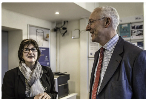
Dans la Poste devenue Maison des services au public