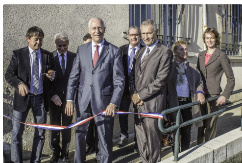
Les autorités s'apprêtent à couper le ruban