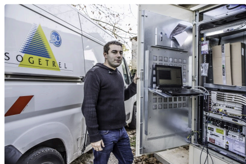
Le technicien travaille au sous-répartiteur de l'église de Bouzon