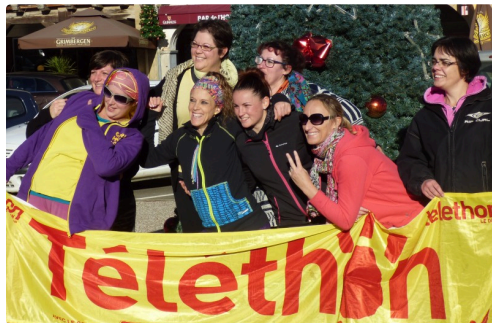
les danseuses de zumba