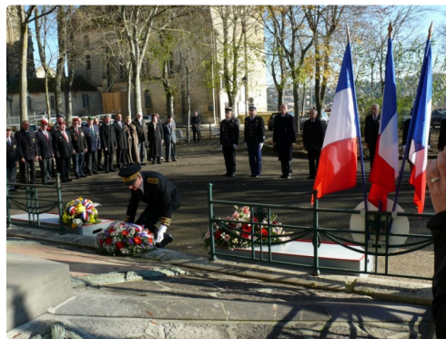
Dépôt de gerbe par le préfet du Gers, Pierre Ory.