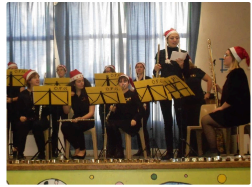
Chut, silence svp, le concert va commencer.