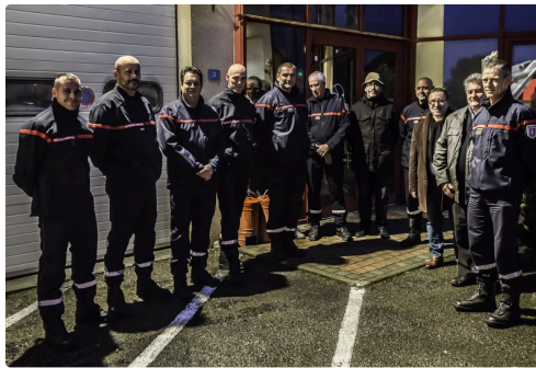
Les autorités et les sapeurs-pompiers présents