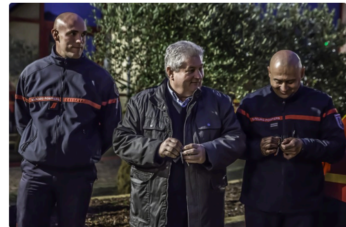
Les clefs des véhicules sont prêtes