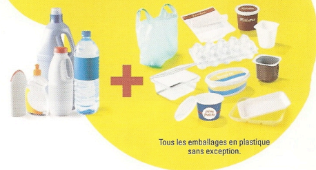
Tous les emballages en plastique sans exception.

Vous continuez à déposer dans votre bac de tri tous les emballages métalliques, les emballages en carton, les papiers et, en plus de cela, tous vos emballages en plastique sans exception.