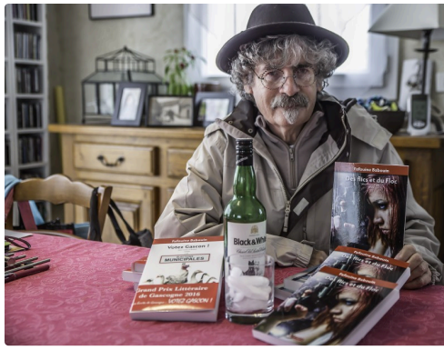
...et posant volontiers en Bob Marlowe, fameux détective privé héros de Raymond Chandler