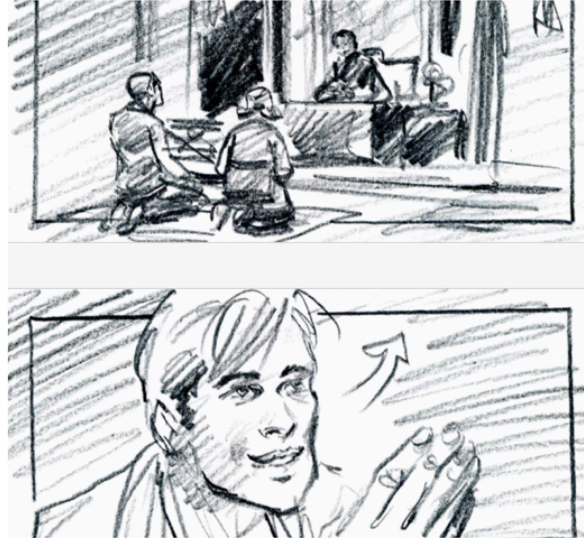
Cinéma l'Europe a Plaisance