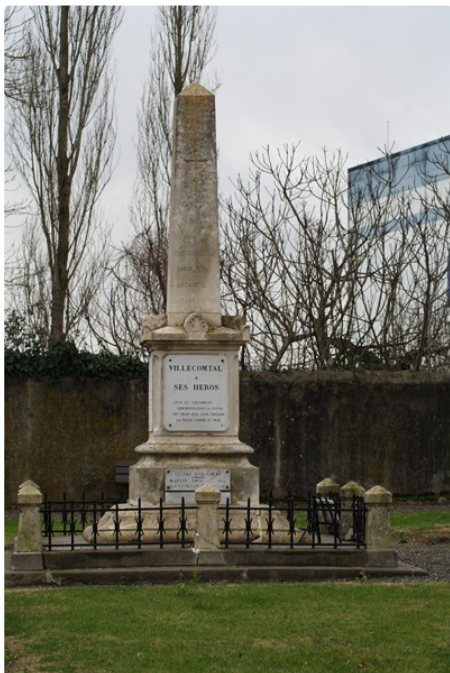
Villecomtal sur Arros.jpg