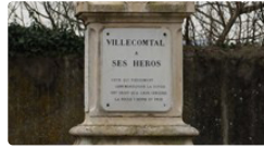
Une journée du 11 novembre bien fournie.

La municipalité organise la cérémonie au monument aux Morts à 11 heures, suivie d'un vin d'honneur.