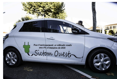
La Zoé du Sictom Ouest