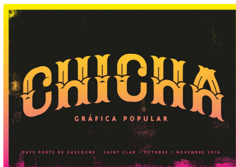
Chicha St-Clar R.jpg