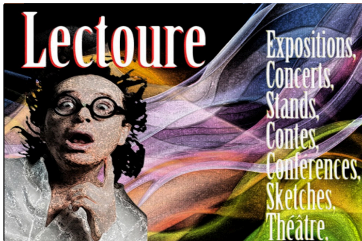
Vous avez dit bizarre, comme c'est bizarre ce festival de tous les arts

Théâtre, musique, photos, peinture, lecture faites votre choix